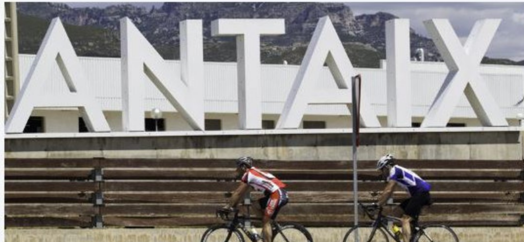
La fàbrica de mobles Naturantaix ha arribat a ocupar més de 400 treballadors. JOSÉ CARLOS LEÓN.